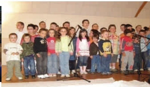
La chorale de l'école ... un succès fou !