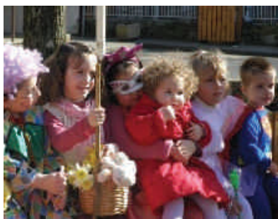
Déguisons-nous, c'est le carnaval !

Nous tenions à remercier toutes les personnes qui aident l'APE et à tous, nous et nos « loustics » vous souhaitons une BONNE ANNEE 2009.