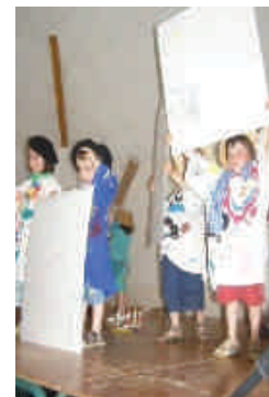
Vive la Fête de l'école !