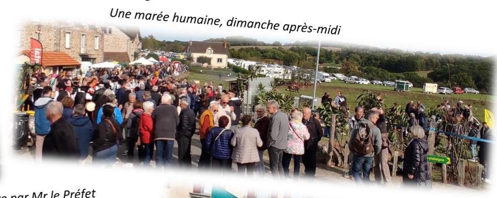
Une marée humaine, dimanche après-midi