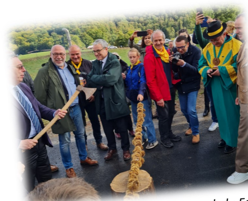
Inauguration de la Foire par Mr le Préfet

L'assemblée générale de l'association se tiendra le samedi 09 décembre à 19h00. Pensez à vous inscrire au 04 71 49 69 34 ou par mail à foire.chataigne@wanadoo.fr (avant le 04 décembre). Bonnes fêtes de fin d'année à tous et RDV l'an prochain pour continuer à fêter la châtaigne avec nous !