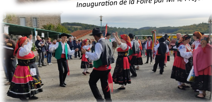
« Le Rancho » groupe de musique et danses portugaises